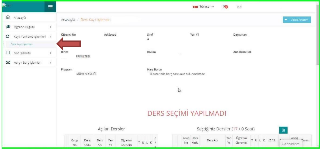
Resim 2- Kayıt Yenileme (Ders Seçme) İşlemleri Sayfası

2. Sisteme başarı ile giriş yaptıktan sonra aşağıda “Resim-2” de gösterilen sayfa karşınıza gelecektir. Ekranın sol tarafında yer alan menüde bulunan “Kayıt Yenileme (Ders Seçme) İşlemleri” bağlantısını tıklayarak ders seçimi yapılacak olan sayfaya erişim sağlayınız.