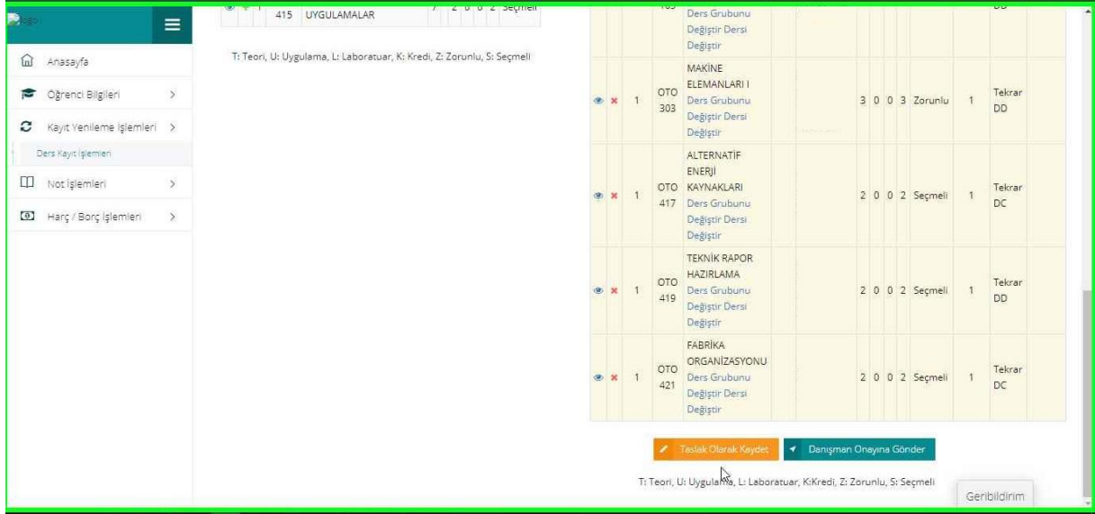
Resim-4: Kaydetme ekranı

4. Derslerinizi seçtikten ve Seçilen Dersleri ekledikten sonra “Seçilen Dersler” bölümüne geçerek derslerinizi son bir defa kontrol ederek aşağıda resimde gösterilen “Danışman Onayına Gönder” butonu vasıtasıyla derslerinizi, danışmanınıza gönderebilirsiniz. Danışman onayına göndermeden önce “Taslak Olarak Kaydet” butonu ile seçimini yaptığınız dersleri kaydedebilir, daha sonra tekrar düzenleyebilir ve seçilen dersleri kesinleştirdikten sonra danışman onayına gönderebilirsiniz.