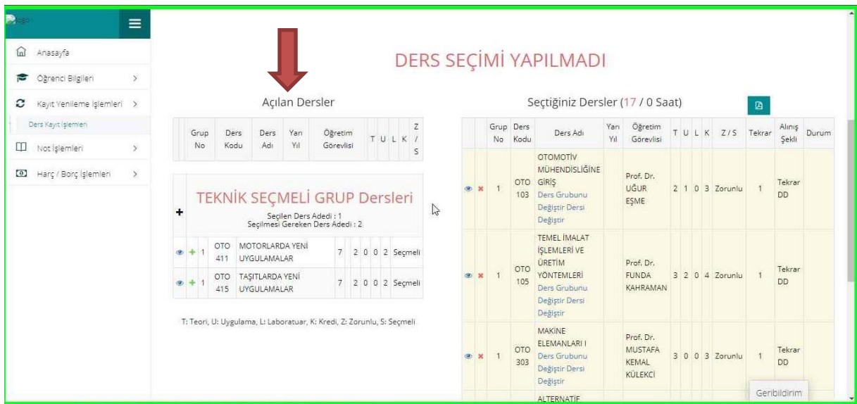
Resim-3 Derslerin Seçilmesi Ekranı

3. Açılan Kayıt Yenileme (Ders Seçme) İşlemleri ekranında “Açılan Dersler” bölümünden seçebileceğiniz dersleri görebilir ve aynı ekrandan kayıt yaptırmak istediğiniz dersleri seçerek “Seçilen Dersleri Ekle” butonu vasıtasıyla ders seçim işlemi tamamlayabilirsiniz.